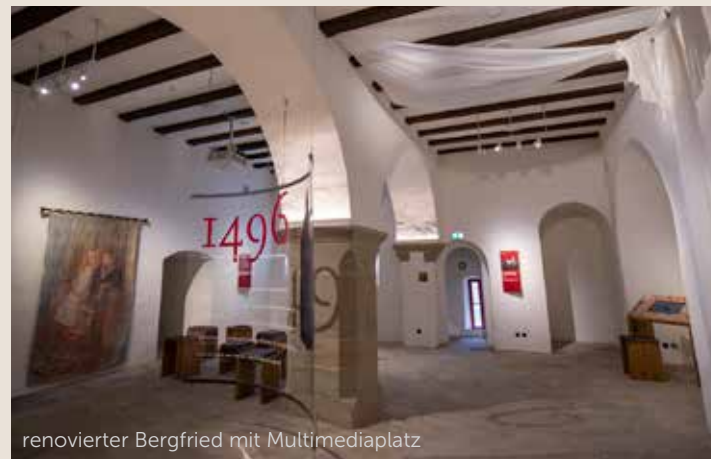
renovierter Bergfried mit Multimediaplatz