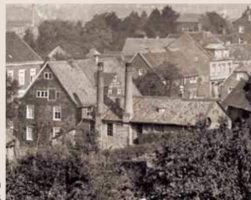
Brauerei Kupper Eich heute altes Brauhaus

Eintrittspreis Schloss Burg: 5,-€ pro Person, Parkplatzempfehlung: „In der Planke“ Treffpunkt 14.15 Uhr im Burghof